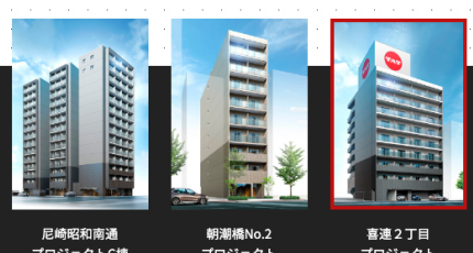
尼崎昭和南通 プロジェクトC棟

タット・プラン&Tが手掛ける 2022-2023年のプロジェクトについてご紹介します。