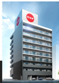
喜連2丁目プロジェクト