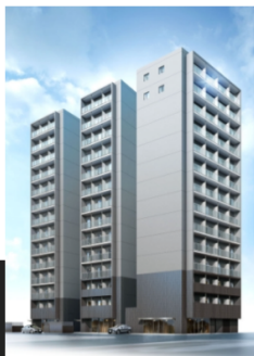
尼崎昭和南通プロジェクトC棟