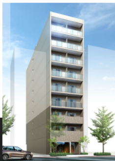
朝潮橋No.2プロジェクト