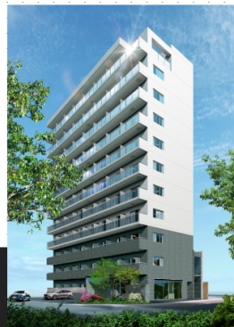
住之江公園プロジェクトA棟