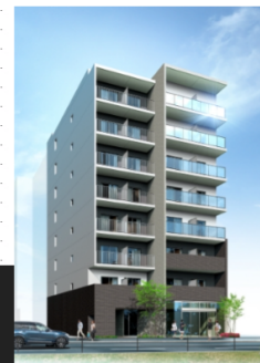
吉田駅前プロジェクトA棟