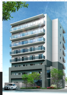
住之江公園プロジェクトB棟