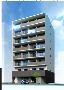
吉田駅前プロジェクトB棟