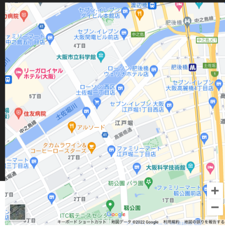
タット・プラン工事株式会社 (タット・土佐堀ビル)