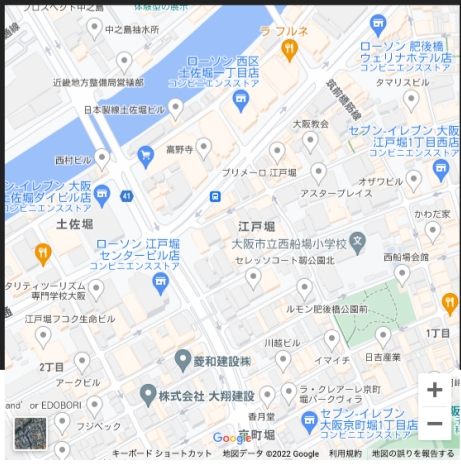
タット・プラン&T株式会社 (本社タット・建設ビル2F・3F)

大阪市西区江戸堀1丁目25番30号 大阪メトロ四つ橋線「肥後橋駅」 大阪メトロ⑧番出口より徒歩5分