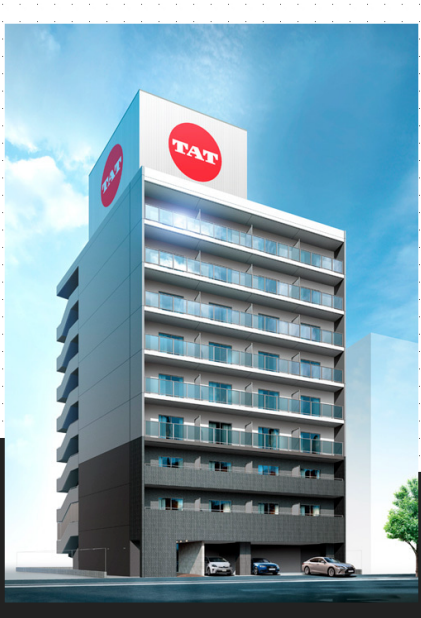
喜連2丁目プロジェクト